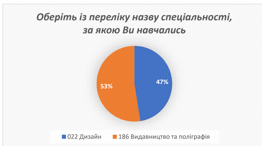
Рис. 1 – відповіді на запитання «Оберіть із переліку назву спеціальності, за якою Ви навчались»

Відповідно до відповідей, зазначених на рис. 1, в опитуванні взяли участь 21 (53%) випускник спеціальності 186 Видавництво та поліграфія та 19 (47%) – 022 Дизайн. 100% респондентів 2024 року випуску.