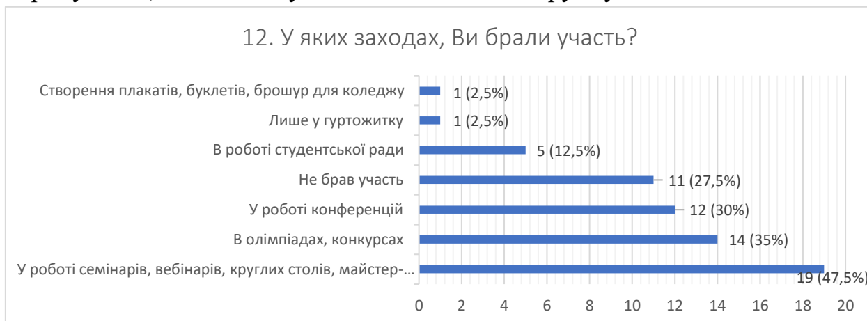
Рис. 13 – відповіді на запитання «У яких заходах, Ви брали участь?»

Розширюючи попередню інформацію, випускники також відзначили активне впровадження викладачами наукових та практичних заходів професійного спрямування, таких як конференції, тренінги, майстер-класи, екскурсії, зустрічі з фахівцями та роботодавцями, що підтверджують 82% відповідей респондентів. Отже, в коледжі надається особлива увага розвитку фахових навичок студентів за допомогою різноманітних заходів професійного спрямування, в яких здобувачі освіти активно беруть участь.