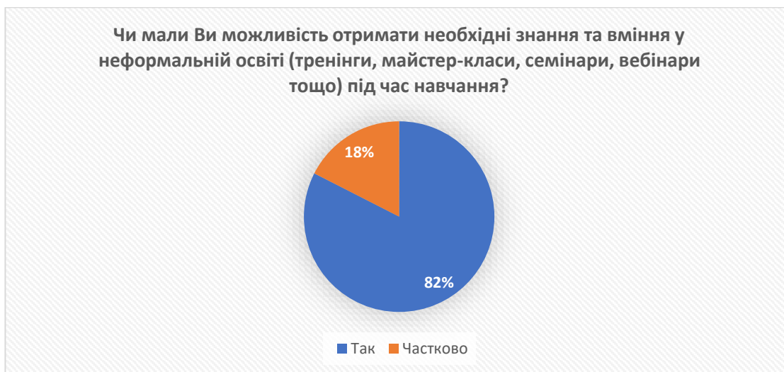
Рис. 11 – відповіді на запитання «Чи мали Ви можливість отримати необхідні знання та вміння у неформальній освіті (тренінги, майстер-класи, семінари, вебінари тощо) під час навчання?»

побажань здобувачів освіти в межах постійного вдосконалення методів навчання.