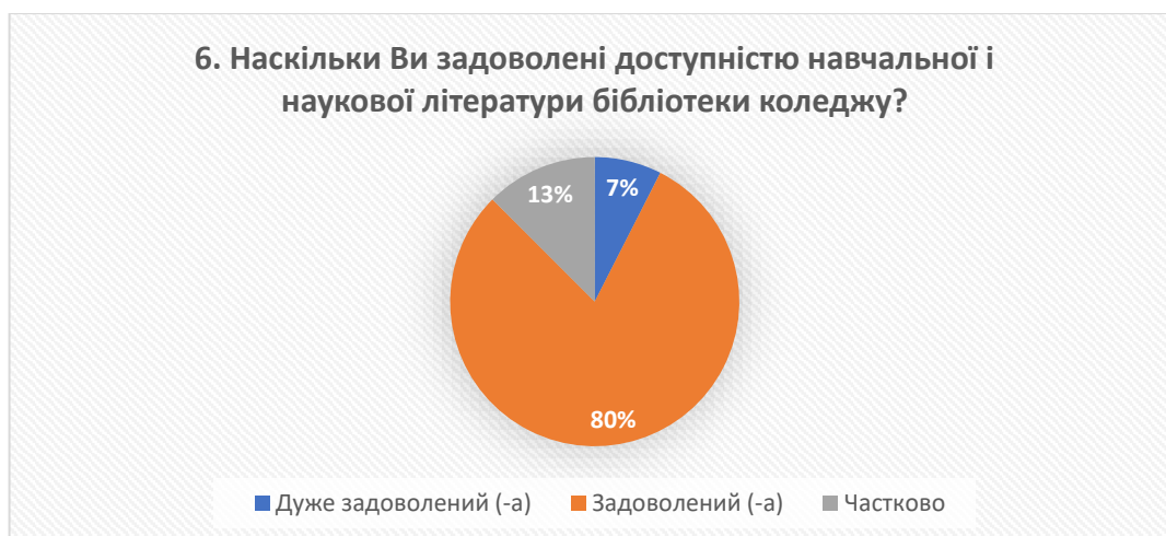
Рис. 6 – відповіді на запитання «Наскільки Ви задоволені доступністю навчальної і наукової літератури бібліотеки коледжу?»

Аналіз відповідей на запитання про задоволеність доступністю навчальної та наукової літератури в бібліотеці коледжу показав, що 7% респондентів дуже задоволені, 80% – задоволені, а 13% – частково задоволені. Це свідчить про ефективну роботу бібліотеки та відповідність її потребам здобувачів освіти.