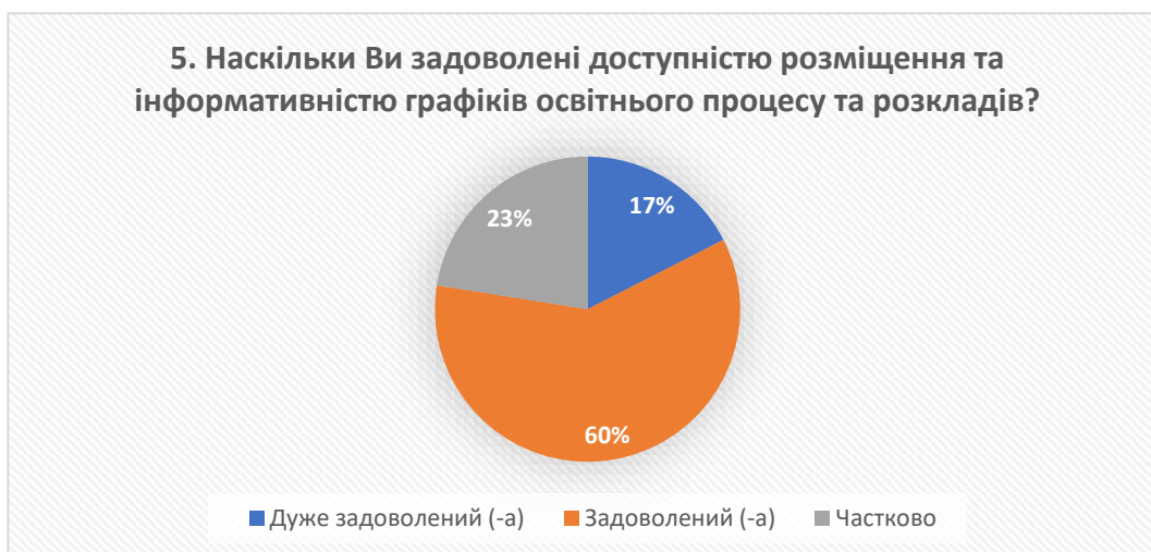
Рис. 5 – відповіді на запитання «Наскільки Ви задоволені доступністю розміщення та інформативністю графіків освітнього процесу та розкладів?»

Опитування виявило, що більшість випускників (77%) цілком задоволені (10% – дуже задоволені та 67% – задоволені) співвідношенням теоретичної та практичної частин освітнього процесу, що свідчить про ефективну структуру освітньо-професійних програм, які систематично переглядаються з метою удосконалення.