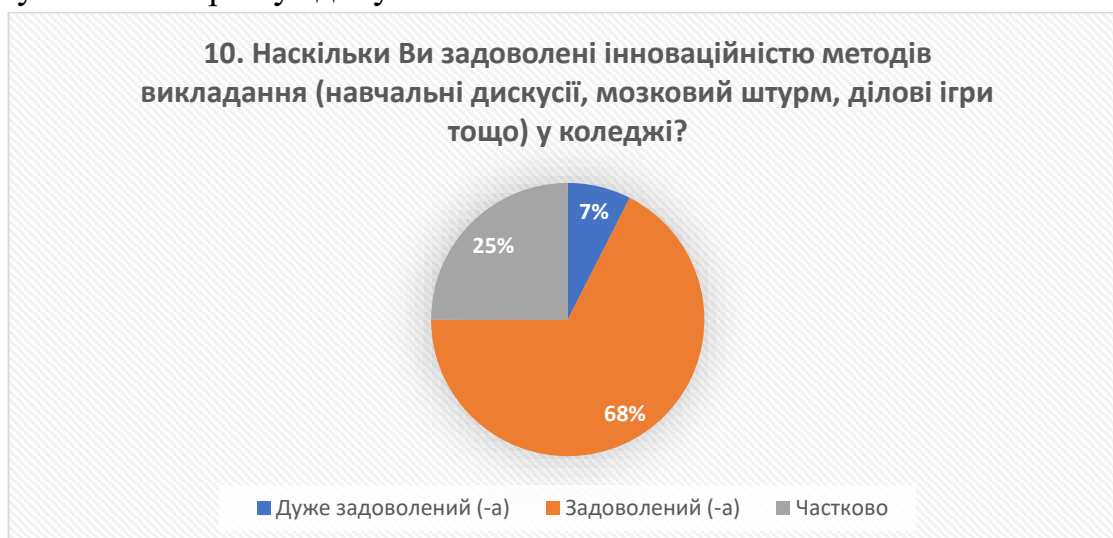
Рис. 10 – відповіді на запитання «Наскільки Ви задоволені інноваційністю методів викладання (навчальні дискусії, мозковий штурм, ділові ігри тощо) у коледжі?»

Відтак, більшість респондентів зазначають, що найбільш ефективними та зручними методами оцінювання навчальних досягнень традиційні форми, такі як залік (77,5%) та екзамен (47,5%). Ці методи визнаються як найкращі для охоплення програми дисциплін, що забезпечують об'єктивну оцінку знань і розуміння матеріалу здобувачами освіти.