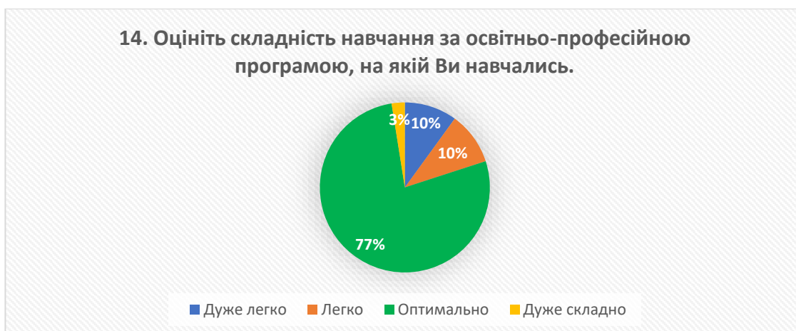
Рис. 14 – відповіді на запитання «Оцініть складність навчання за освітньо-професійною програмою, на якій Ви навчались»

Аналіз результатів щодо визначення складності навчання за відповідною освітньо-професійною програмою показує, що 77% випускників вважають складність навчання на оптимальному рівні. Додатково, 10% відзначили навчання як «дуже легке», 10% - як «легке», а лише 3% вважають його «дуже складним».