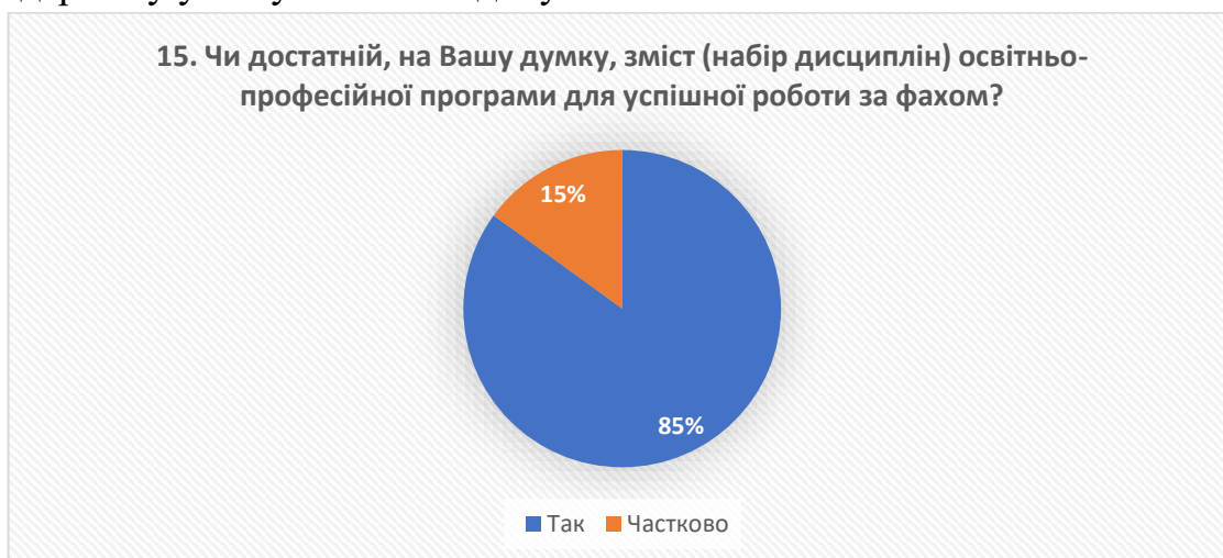
Рис. 15 – відповіді на запитання «Чи достатній, на Вашу думку, зміст (набір дисциплін) освітньо-професійної програми для успішної роботи за фахом?»

Такий результат вказує на ефективність адаптації навчального процесу до їхніх потреб. Крім того, різноманітність відповідей щодо сприйняття складності навчання свідчить про індивідуалізацію підходів та врахування різних стилів навчання серед здобувачів освіти. Це підкреслює успішне впровадження гнучкого та адаптивного освітнього середовища, спрямованого на підтримку успіху кожного здобувача освіти.