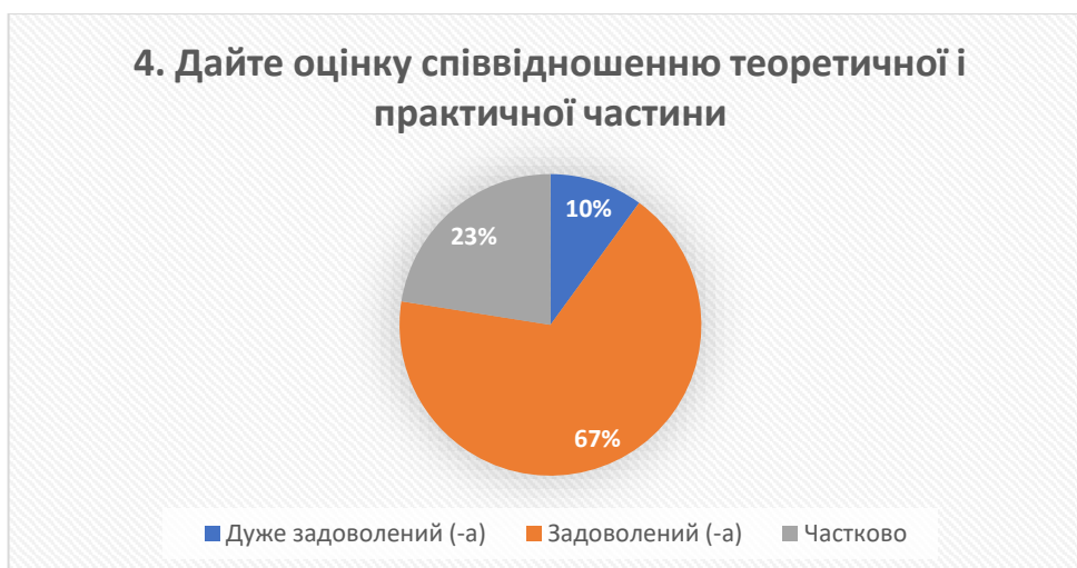
Рис. 4 – відповіді на запитання «Дайте оцінку співвідношенню теоретичної і практичної частини»

Опитування виявило, що більшість випускників (77%) цілком задоволені (10% – дуже задоволені та 67% – задоволені) співвідношенням теоретичної та практичної частин освітнього процесу, що свідчить про ефективну структуру освітньо-професійних програм, які систематично переглядаються з метою удосконалення.