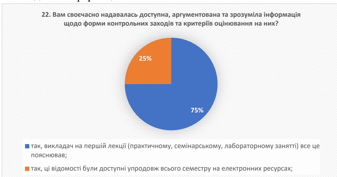
Рис. 18 – відповіді на запитання «Вам своєчасно надавалась доступна, аргументована та зрозуміла інформація щодо форми контрольних заходів та критеріїв оцінювання на них?»

на електронних ресурсах коледжу. Це свідчить про позитивне сприйняття системи надання інформації стосовно освітніх компонентів.