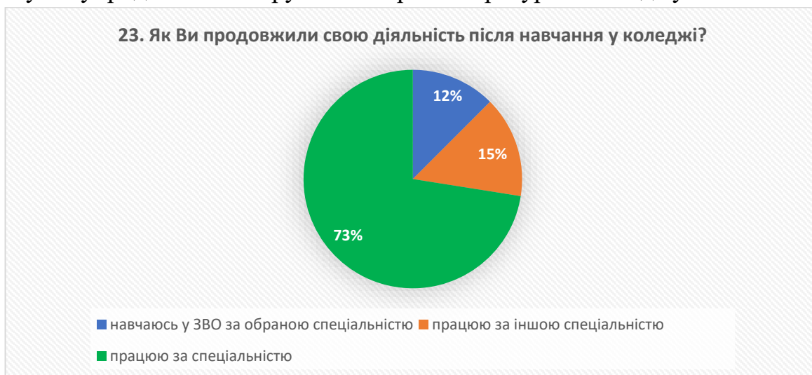
Рис. 19 – відповіді на запитання «Як Ви продовжили свою діяльність після навчання у коледжі?»

Більшість респондентів (75%) також зазначили, що під час першого заняття викладачами своєчасно надавалась доступна, аргументована та зрозуміла інформація щодо форм контрольних заходів та критеріїв оцінювання в межах дисциплін та 25% підтвердили, що ці відомості були доступні упродовж семестру на електронних ресурсах коледжу.