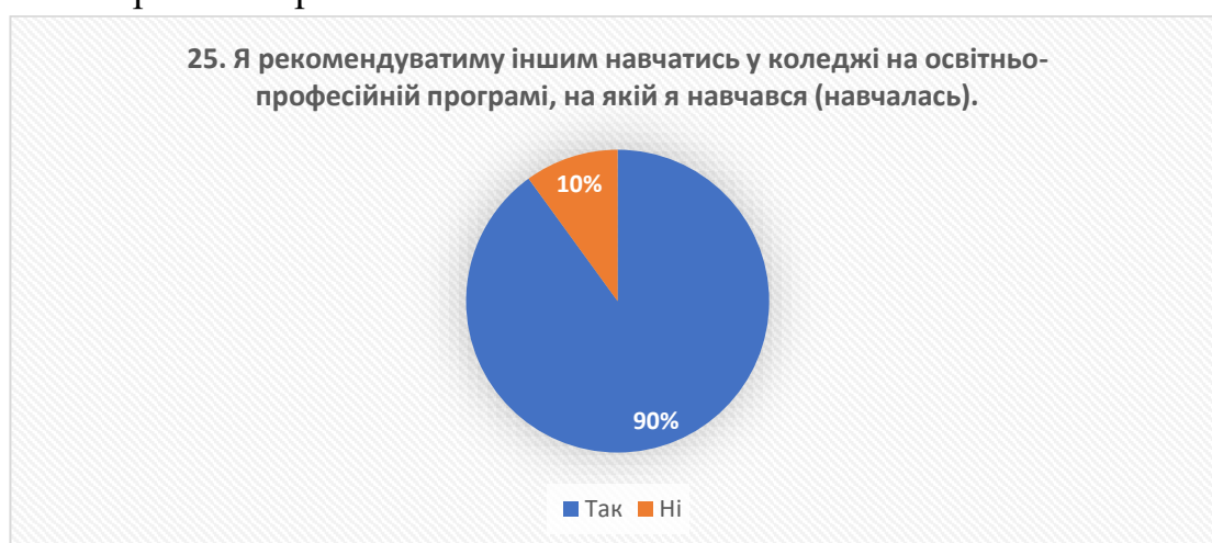
Рис. 20 – відповіді на запитання «Я рекомендуватиму іншим навчатись у коледжі на освітньо-професійній програмі, на якій я навчався (навчалась)»

Як бачимо, респонденти висловили свої пропозиції щодо збільшення кількості творчих та практичних занять.