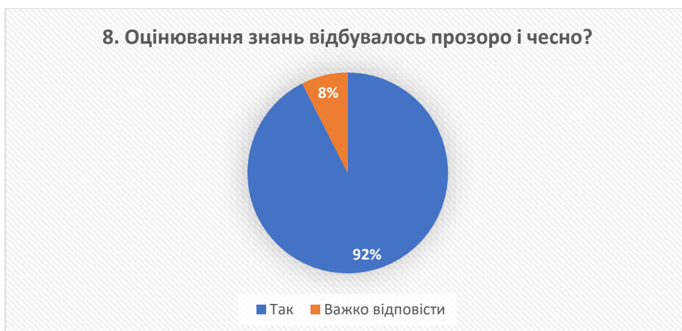
Рис. 8 – відповіді на запитання «Оцінювання знань відбувалось прозоро і чесно?»

Аналіз результатів опитування щодо прозорості та чесності оцінювання знань показав, що більшість випускників, а саме 92%, підтверджують, що викладачі проводять об'єктивне оцінювання. Невелика кількість відповідей «важко відповісти» може бути зумовлена індивідуальними особливостями респондентів та можливими суперечливими ситуаціями між ними і педагогічними працівниками під час навчання, що є типовим для освітнього процесу.