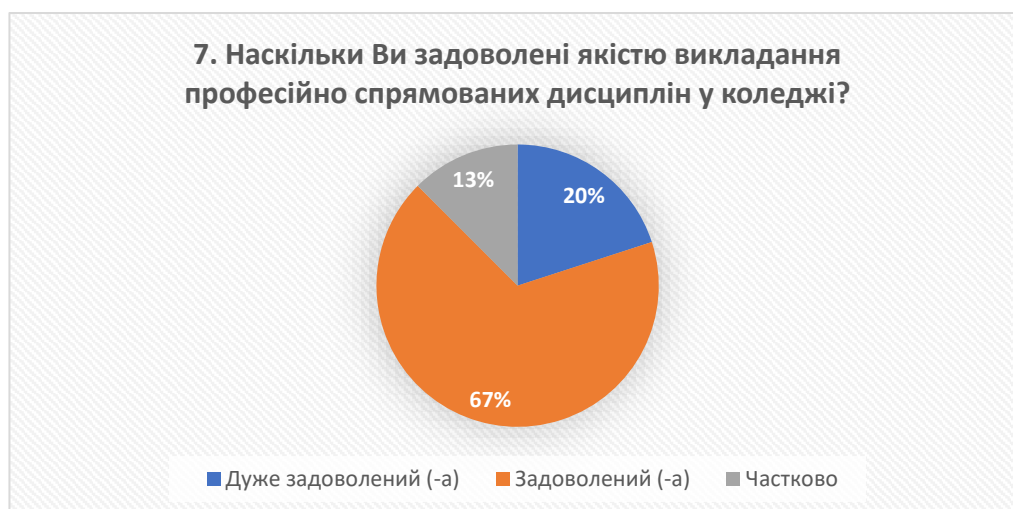
Рис. 7 – відповіді на запитання «Наскільки Ви задоволені якістю викладання професійно спрямованих дисциплін у коледжі?»

Аналіз відповідей на запитання про задоволеність доступністю навчальної та наукової літератури в бібліотеці коледжу показав, що 7% респондентів дуже задоволені, 80% – задоволені, а 13% – частково задоволені. Це свідчить про ефективну роботу бібліотеки та відповідність її потребам здобувачів освіти.