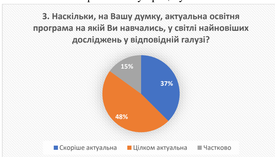
Рис. 3 – відповіді на запитання «Наскільки, на Вашу думку, актуальна освітня програма на якій Ви навчались, у світлі найновіших досліджень у відповідній галузі?»

На наявність дружнього освітнього середовища вказують відповіді більшості респондентів (77%), що свідчить про створений у коледжі сприятливий клімат для навчання та спілкування з викладачами, що сприяє позитивним взаєминам та ефективному процесу навчання.