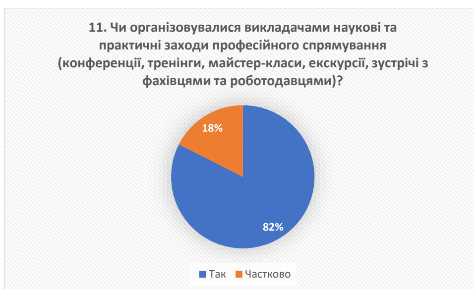
Рис. 12 – відповіді на запитання «Чи організовувалися викладачами наукові та практичні заходи професійного спрямування (конференції, тренінги, майстер-класи, екскурсії, зустрічі з фахівцями та роботодавцями)?»

Значна частина випускників (82%) підкреслюють, що мали можливість набути знань та навичок завдяки неформальній освіті (тренінги, майстер-класи, семінари, вебінари тощо). Це свідчить про те, що такі форми навчання стають дедалі популярнішими та активно впроваджуються у навчальний процес у коледжі з метою розвитку практичних навичок, які є важливими для успішної кар'єри у сучасному світі.