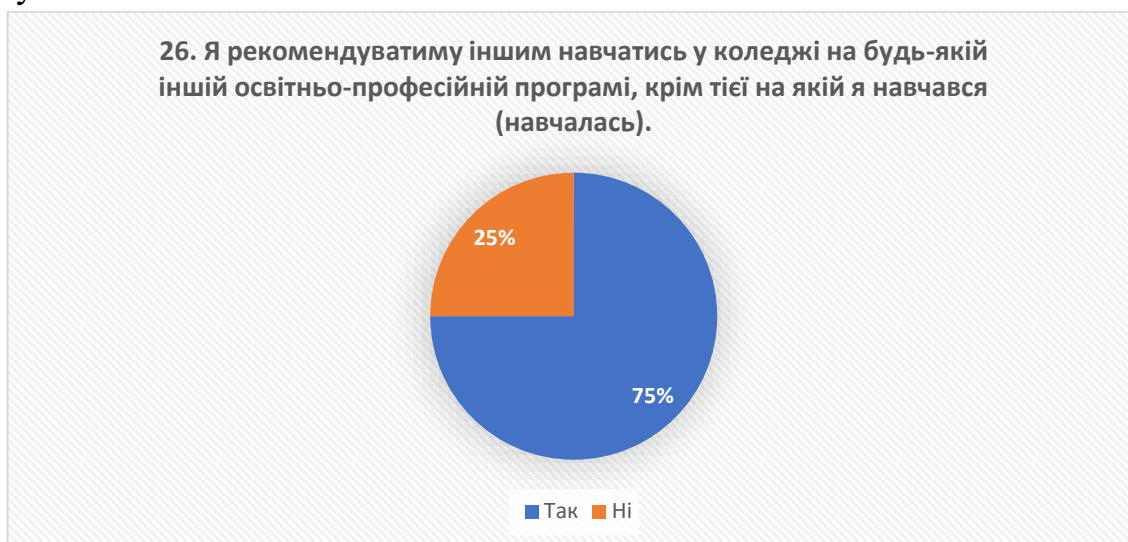
Рис. 21 – відповіді на запитання «Я рекомендуватиму іншим навчатись у коледжі на будь-якій іншій освітньо-професійній програмі, крім тієї на якій я навчався (навчалась)»

ефективної підготовки фахівців у коледжі та задоволення їхніх потреб і очікувань.