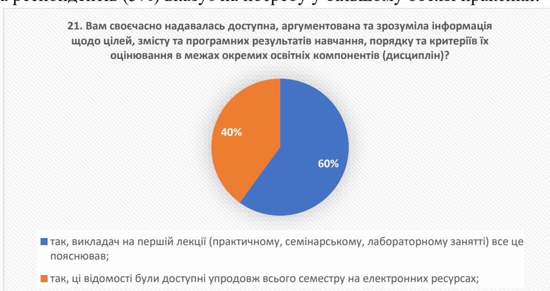
Рис. 17 – відповіді на запитання «Вам своєчасно надавалась доступна, аргументована та зрозуміла інформація щодо цілей, змісту та програмних результатів навчання, порядку та критеріїв їх оцінювання в межах окремих освітніх компонентів (дисциплін)?»

У висновку важливо підкреслити, що більшість випускників (95%) вважають, що обсяг практичної підготовки в освітніх програмах є достатнім, що свідчить про їхнє задоволення рівнем практичних занять. Однак, невелика частка респондентів (5%) вказує на потребу у більшому обсязі практики.