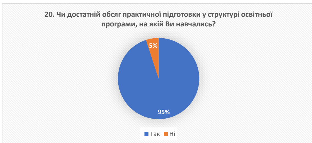
Рис. 16 – відповіді на запитання «Чи достатній обсяг практичної підготовки у структурі освітньої програми, на якій Ви навчались?»

У висновку важливо підкреслити, що більшість випускників (95%) вважають, що обсяг практичної підготовки в освітніх програмах є достатнім, що свідчить про їхнє задоволення рівнем практичних занять. Однак, невелика частка респондентів (5%) вказує на потребу у більшому обсязі практики.