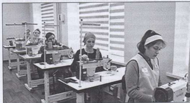
Рис. 1. Майстерня навчально-практичного центру технологій та дизайну

На базі коледжу створено Навчально-практичний центр технологій та дизайну для підготовки фахівців швейної галузі, інформаційно-ресурсний центр, салон краси «Beauty HUB», лабораторію IT-технологій. Ці структурні підрозділи забезпечують функціонування напрямку «Освіта дорослих».