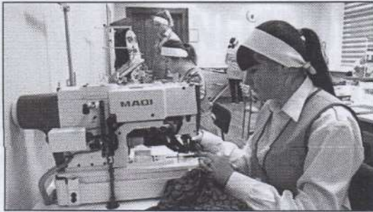
Рис. 2. Майстерня навчально-практичного центру технологій та дизайну

вачі освіти, так і слухачі курсової підготовки за базовим курсом «Кравець», «Закрійник» та слухачі модульних короткострокових курсів.