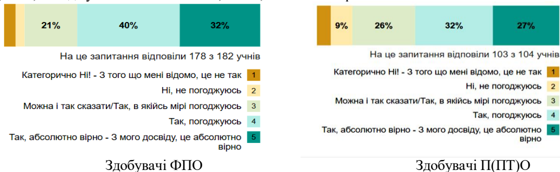
Рис. 2. Розподіл відповідей серед здобувачів освіти щодо можливостей обговорення переваг та недоліків викладання і навчання з використанням цифрових технологій

Про постійний фокус уваги щодо ефективності використання цифрових технологій в освітньому процесі та обговорення переваг та недоліків викладання і навчання з використанням цифрових технологій зазначають з абсолютною впевненістю 55 % відсотків педагогічних працівників, 40 % – погоджуються. Розподіл відповідей серед здобувачів освіти представлено наступним чином (рис. 2): надали відповіді 178 здобувачів фахової передвищої та 103 здобувачі професійної (професійно-технічної) освіти, з них, «категорично ні» 1 % та 6 %; «ні» відповіли відповідно 2 % та 9 %, «так, в якійсь мірі погоджуюсь» – 21 % та 26 %, «так, погоджуюсь» – 40 % та 32 %, і «так, абсолютно правильно» – 32 % та 26 %.